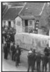
Historische Stoet (3): maquette oude boerderij (GZ Tul077)