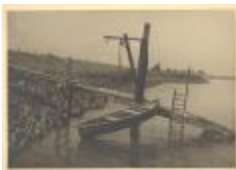
Steigertje bij scheldedijk aan Krankeloon (PCPZ20141121_001)