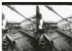
Scheepswerf Maes (1): arbeider (GZ Tul084)