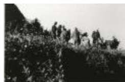
Malpertus / Vos Reinaert (GZTul013)