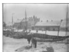
Ijsgang op de Schelde (3): mannen op dichtgevroren Schelde (GZTul 103)