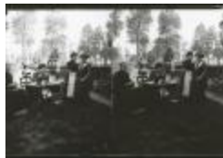
Burchtse Zelfstandigen (5): paspop (GZ Tul083)