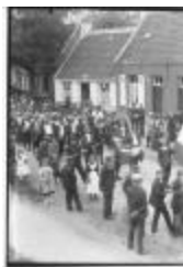
Historische Stoet (2): grosse-caise (GZ TUL076)