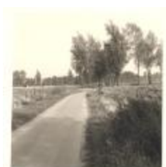
Polder bij Blokkersdijk (PCPZ20141121_027)