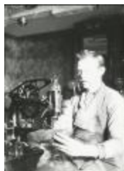
Burchtse Zelfstandigen (2): schoenmaker (GZ Tul079)