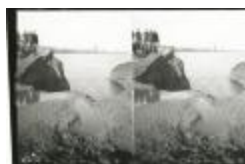
Dijkdoorbraak bij De Schelde (GZTul015)