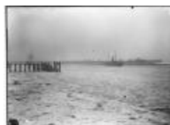
Ijsgang op de Schelde (2): aanlegsteiger (GZTul 102)