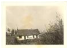
Huizeke Juffrouw Verspecht (PCPZ20130521_041)