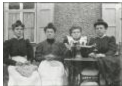
Burchtse Zelfstandigen (1): naaisters (GZ Tul078)