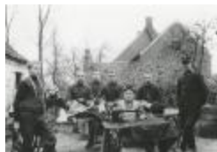
Burchtse Zelfstandigen (3): naaister in open lucht (GZ Tul080)