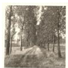
Dreef bij Blokkersdijk (PCPZ20141121_028)