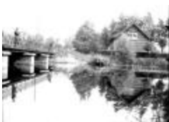
Soldaten oefeningen (15): brug en paviljoen (GZTul164)