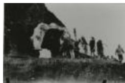
Kain en Abel (GZTul014)