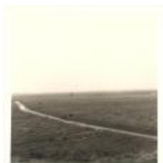
Boerveldse beek in de Melselepolder (PCPZ20141121_026)