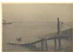
Steigertje bij Krankeloon bij eb (PCPZ20141121_002)