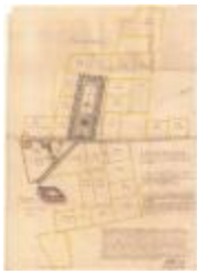
Wijkaart van wijken Kloosterland en Beenaert (Cloosterlant Wijk A4 256/257)