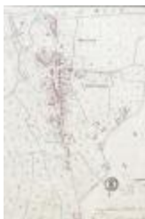
Kadastraal plan Belsele, detailopname dorpskern (SASN20120510_004)