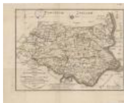
Overzichtskaart van district Sint-Niklaas (K 471)