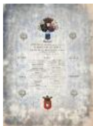
Banket koninklijk bezoek Sint-Niklaas, 17 september 1865 (SASN20101119_004)