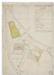
De markt en het centrum van Sint-Niklaas (K 508)