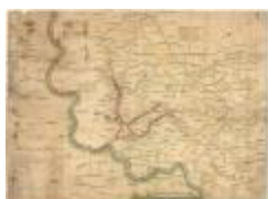
Oorlogskaart, Lokeren (K 483)