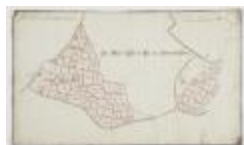
Wijkaart van Haasdonk, omgeving Perstraat en Botermelkstraat (K 475)