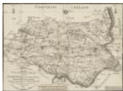
Nieuwe plaatsbeschrijfkundige kaart van het distrikt Sint-Nikolaas voorheen Land van Waas (BWK&P_20110101_112)