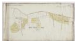
Figuratieve Caerte van de Cappeljau Thiende (K 474)