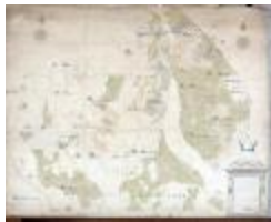
Kaart van heerlijkheden het Beverse, Puiembeke, Paddeschoot en Aarschot te Sint-Niklaas, 1786 (SASN20120510_010)