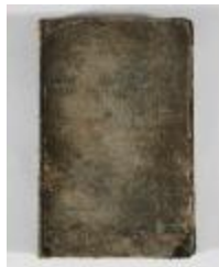
Kaartboek Sint-Gillis-Waas (KOKW Kaartboek Sint-Gillis-Waas Du Caju)