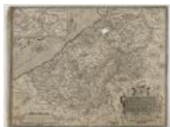
Ortelius, Kaart van Vlaanderen (K 559)