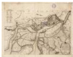
Popp-kaart: Plan parcellaire de la commune de Elversele avec les mutations (BWK&P_20110101_101)