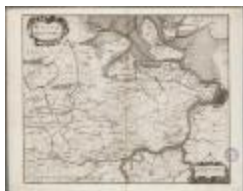
Wasia - 't Land van Waes (BWK&P_20110101_093)