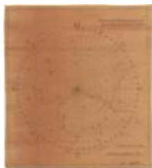
Oriëntering vanop de toren van Temse (Oriëntering_toren_Temsche A4)