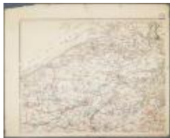
Het graafschap Vlaanderen (BWK&P_20110101_109)