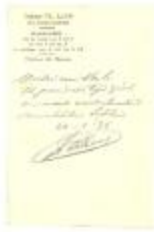
Verzoek huisarts (ERF010511-077)