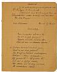
Huldeliëd uitgevoerd door het gemengd koor van Zwijndrecht (8)