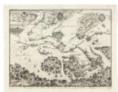
Het beleg der stad Antwerpen (BWK&P_20120415_115)