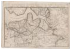
Les environs d'Anvers, d'Hulst, d'Axel, de Santvliet, de Lillo, de Saint-Nicolas et du Sas de Gand (Danet)