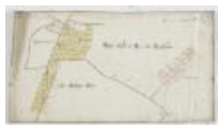
Wijkaart van Haasdonk, omgeving Ropstraat en Bergstraat (K 476)