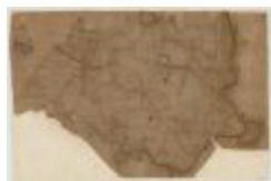
Fricx, Carte très particulière du Pays de Waes (Tres particuliere)