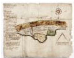
Polderkaart: Aanwassen verloren Cost 1659 (212bisb)