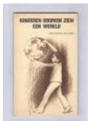
Anton Vlaskop in KINDEREN DROMEN ZICH EEN WERELD (PCAV15112014)