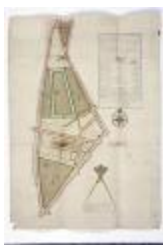
Figuratieve kaart markt Sint-Niklaas, 1765 (SASN20120510_002)