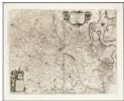
Flandria partes duae quarum altera proprietaria altera imperialis vulgo dicitur (BWK&P_20110101_111)