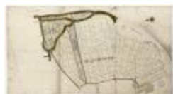
Vierden brouckwijck (Bazel) (BWK&P_20120417_002)