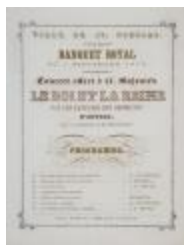
Concert tijdens koninklijk banket stadhuis, 1 september 1878 (SASN20101119_007)