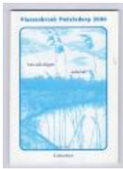
Vlassenbroek Poëziedorp 2000 (PCAV20121103_001)