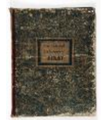
Plan Cadastral der Gemeente Sinay (KOKW Plan Cadastral Sinaai)