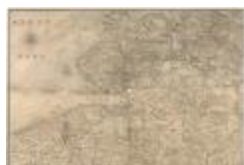
Kaart van Zeeland en de Scheldemonding (Zelande_Escout A4)