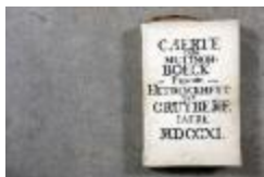
Landboek van Kruibeke (Landboek_Kruibeke)