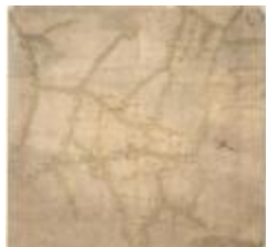
Oorlogskaart, Sint-Gillis-Waas (K 542)