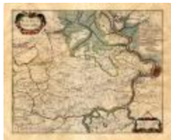
WASIA 't Land van Waes (PCEH20120320_016)