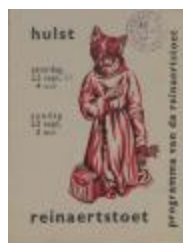
Programma van de Reijndersstoet (BWMA19_20101021_038)