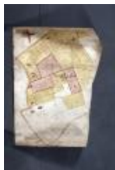
Uittreksel uit ongekend kaartboek van Haasdonk (_88D9692 kopie)