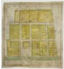
Kaart van Doeldorp (G51)