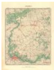
Dépot de la Guerre: Lokeren (Lokeren A4)