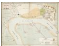
Positie van Antwerpen (BWK&P_20110101_098)