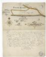
Kaart van een schor nabij Bazel (BWK&P_20120421_135)