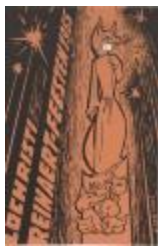
Programmabrochure Reijndersfeesten Lochristi (BWMA19_20101021_026)