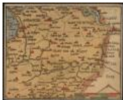
De Charte van Vlaenderen (Het Land van Waas_Heyns A4)