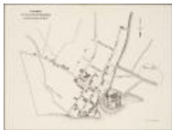
Fragment du plan de Rupelmonde (BWK&P_20110101_102)