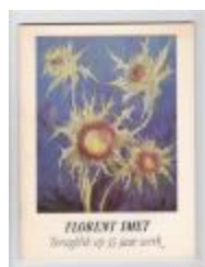
Florent Smet : Terugblik op 35 jaar werk 1979 (PCAV20121227_001)