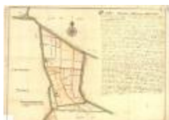
Perceelkaart van de regio Arenbergpolder (K 588)