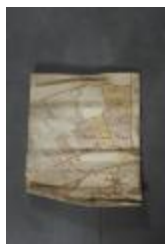
Uittreksel uit ongekend kaartboek van Haasdonk (_88D9686 kopie)