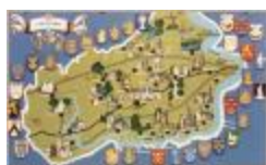
Toeristische kaart van het Waasland (BWK&P_20110101_061)