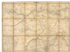
Vandermaelen: Lokeren en Dendermonde (Lokeren_Termonde A4)