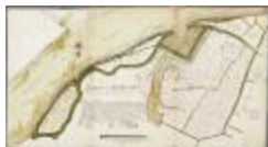
Caerten figurative van alle landen gelegen in Baesel ende Rupelmonde Broeck... (BWK&P_20110101_103)