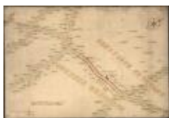
Oorlogskaart: Stekene (Stekene_dorp A4 248/257)