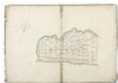
Perseelkaart Schausselbroeck Oosteynde (210)