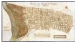
Figuratieve kaart van de heerlijkheid van Cauwerburgh (GAT20120521_001)