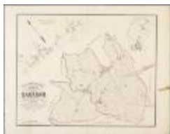
Popp-kaart: Plan parcellaire de la commune de Dacknam avec les mutations (BWK&P_20110101_099)