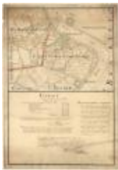
Polders van Kallo, Sint-Anna Ketenisse, Doel en Arenberg (Liefkenshoek A4)