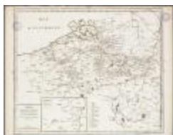
Carte du Hainault, Flandre, Brabant, Luxembourg et Païs de Limbourg (BWK&P_20110101_107)