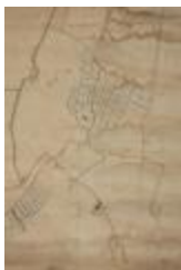
Figuratieve kaart Vrasene, 1767 (SASN20120510_009)