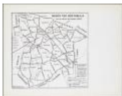
Wijken van Sint-Niklaas naar de oude kaart van Semeelen (BWK&P_20110101_106)