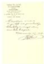
Verzoek huisarts (ERF010511-073)