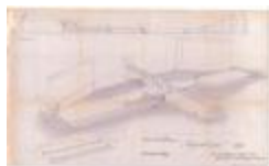
Reynaertspel 1973, technisch plan podium Grote Markt (SASN20110512_048)