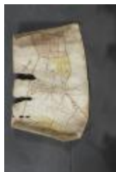
Uittreksel uit ongekend kaartboek van de regio Beveren (_88D9685 kopie)