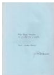
Jo Van Eetvelde componeerde muziek op 'Het gebaar' van Anton Vlaskop (PCAV20150721_003)