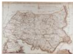
J.B. de Bouge, Carte Topographique du Pays de Waes (K 373)