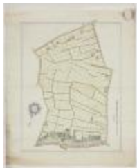
Wijkaart Bormtmeulenakker, Stekene (K 452)