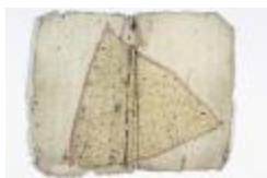
Kaartboek Sint-Niklaas, met wijkkaarten, 1696 (SASN20120510_012)