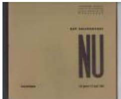
Het Zelfportret Nu : Samensteller en layout Anton Vlaskop (PCAV20121202_001)