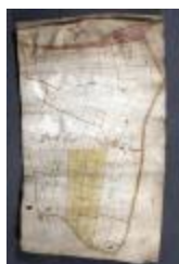
Uittreksel uit ongekend kaartboek van Haasdonk (_88D9694 kopie)