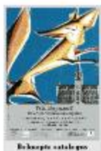
Beknopte catalogus 'Wij, Reynaert!' (WAS20110525_001)