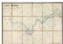
Carte des Polders (BWK&P_20110101_97)