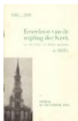
Programmabrochure eeuwfeest O.L.Vrouw ten Hemel opgenomen (pcpp20110310_001)