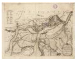
Tabula castelli ad Santflitam,... (BWK&P_20110101_095)