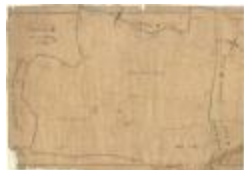
Kadastrale kaart van Beveren (Beveren_SectionD_3eFeuille)