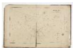
Kadastrale atlas Belsele, 1856 (SASN20120510_003)