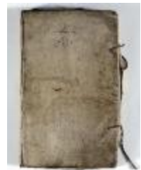
Kaartboek Sint-Pauwels (KOKW Kaartboek Sint-Pauwels Maes)