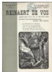
Programmabrochure éénmanstoneel Reynaert de Vos (BWMAP19_20101021_023)