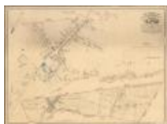
Popp-kaart: Clinge (Clinge_Popp A4)