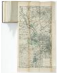
Springtij van 1906 in het Scheldebekken (BWK&P_20120421_121)