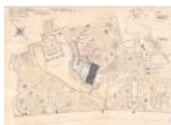
Reynaertspel 1985, technisch plan stadspark (SASN20110512_049)