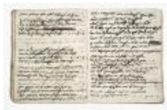
Journal van inkomsten en uitgaven (schenking2005.01)