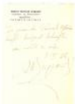
Verzoek huisarts (ERF010511-074)