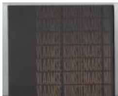
Vlaamse Kunstenaars nu 23 juni - 9 juli '67: Anton Vlaskop (PCAV20121111_007)