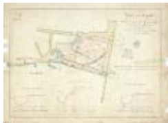
Kasteel van Temsche (BWK&P_20120417_117)