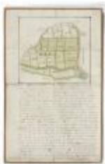
Perceelkaart Meulenbroeck (210bis)