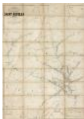
Popp-kaart: Kadastraal plan Sint-Niklaas, Popp 1/5000 (SASN20120510_007)