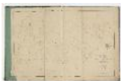
Kadastrale atlas Sinaai, midden 19de eeuw (SASN20120510_005)