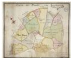
Caerte der prochie van Nieuwerkercken (BWK&P_20120415_114)