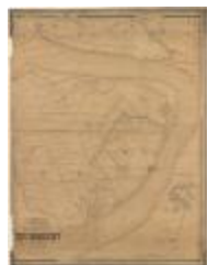
Popp-kaart: Zwijndrecht (Zwijndrecht_Popp A4)