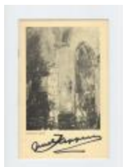
Juul Keppens en Anton Vlaskop (PCAV20130106_001)