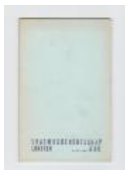
Anton Vlaskop en het Erasmusgenootschap Lokeren (pcav20131003_001)