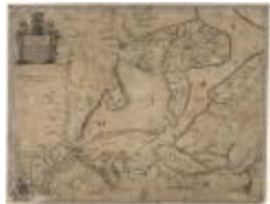
Description de Santvliet, la Rivière Schelde et Pais de Hulst (Santvliet- Hulst A4 253/257)