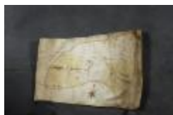
Uittreksel uit ongekend kaartboek van Haasdonk (_88D9691 kopie)