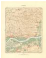
Dépot de la Guerre: Tamise (Tamise A4 227/257)