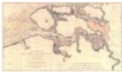
Carte réduite des cotes des Pays-Bas (Côtes des Pays-Bas A4)