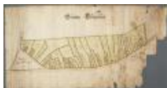
Grooten Clooserlant (BWK&P_20110101_105)