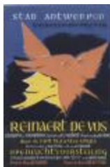
Openluchtvoorstelling Reijnders de Vos (BWMA19_20101021_028)