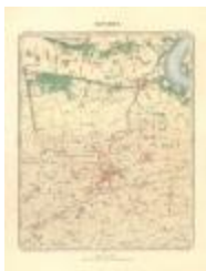
Dépôt de la Guerre: Beveren (Beveren A4)