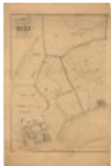
Popp-kaart: Atlas cadastral de Belgique - Commune de DOEL (Doel_Popp A4)