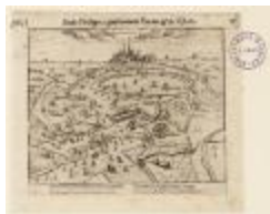
Antverpia sous Philippe 2, gouvernant Parme et les Estats (BWK&P_20110101_094)