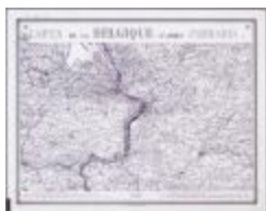
Carte de Belgique d'après Ferraris (BWK&P_20110101_108)