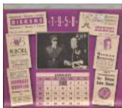
Kalender voor 1958 met foto's Koninklijke bezoeken (BWMA227_20101021_041)