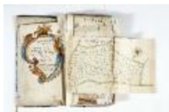
Kaartboek Stekene (KOKW Kaartboek Stekene Vergouwen)