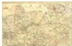
W.T. Hattinga, de Schelde bij Lillo en naast aangelegen landen (Lillo_Hattinga A4)