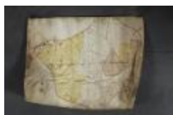
Uittreksel uit een ongekend kaartboek van Haasdonk (_88D9690 kopie)