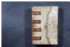
Landboek van Melsele (GAB20122522_001)