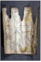
Uittreksel uit ongekend kaartboek van Haasdonk (_88D9696 kopie)