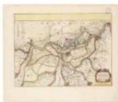
Tabula castelli ad Santflitam,... (BWK&P_20110101_096)