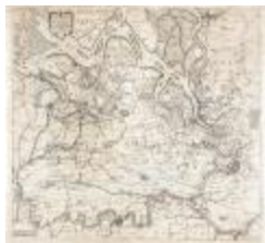
Caerte figurative van 't lant van Waes ende Hulster Ambacht (BWK&P_20120415_113)