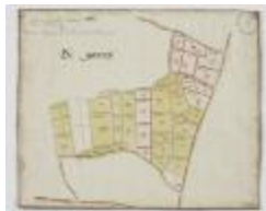
Wijkkaart van Haasdonk, omgeving De Gavers (K 478)