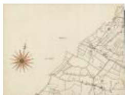
Kaerte figurative van het land van Waes (BWK&P_20110101_091)