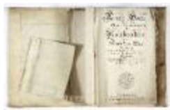
Kaartboek Nieuwkerken, met wijkkaarten, 1726 (SASN20120510_011)