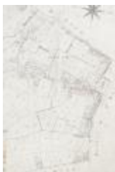
Kadastraal plan Sinaai, detailopname dorpskern (SASN20120510_006)