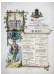
Menukaart inhuldiging nieuw stadhuis, 1 september 1878 (SASN20101119_008)