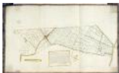
Caertien figuratief van de hooghe landen opde Waessche Clinghe (BWK&P_20110101_100)