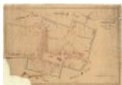
Kadastrale kaart van Beveren (Beveren_SectionD_8eFeuille)