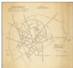
Stad Sint-Niklaas: ontwerp tot het openen van nieuwe straten en lanen (BWK&P_20110101_104)