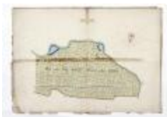
Perceelkaart Schausselbroeck Westeynde (209)