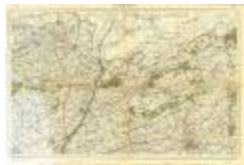
Lokeren (Watervliet) (PCEH20120320_08)