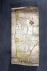
Uittreksel uit ongekend kaartboek van Haasdonk (_88D9698 kopie)