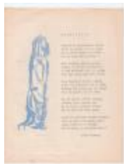
Anton Vlaskop schreef in 1962 een paasliedje (PCAV20130401_01)