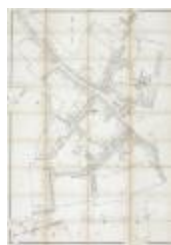
Popp-kaart: Kadastraal plan Sint-Niklaas, Popp 1/2500 (SASN20120510_008)