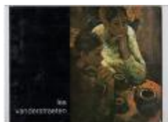
Lea Vanderstraeten en Anton Vlaskop (PCAV20121228_001)