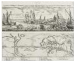
De Slag van Kallo (Liefkenshoek 2006.01.14)