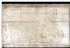
Figuratieve kaart van Elversele, 1716 (_88D5734 kopie)