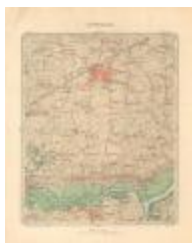
Dépôt de la Guerre, Saint-Nicolas (St-Nicolas A4)