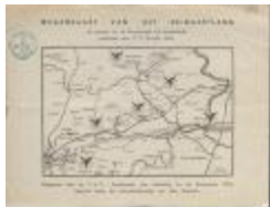
Wegenkaart van het Reinaertland (BWMAP19_20101021_021)