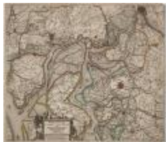
Detail uit Visscher, Nieuwe kaerte van 't Landt van Waes (K 291)