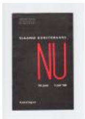
Vlaams Kunstenaars Nu 24 juni - 3 juli 1966: Anton Vlaskop (PCAV20121231_001)