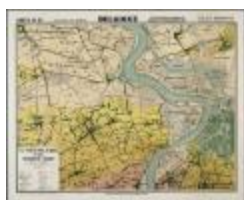
Type du pays de Waes et des polders de l'Escaut (BWK&P_20110101_092)