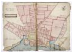
Dorp Temse met dorpsnummers (192)