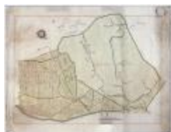
Wijkaart Stekene: Hellestraat-Kappellebrug (K 463)