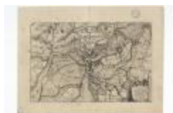
Caerte van 't Scheldt ende Santvliet (BWK&P_20120417_116)