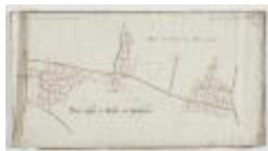
Wijkkaart regio Haasdonk (Zandstraat) en Melsele (K 477)