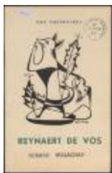
Poppenspel Reijnders de Vos (BWMA19_20101021_030)