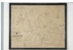
Popp-kaart: Kadasterplan van de gemeente Daknam (1619bis)