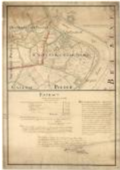
Polders van Kallo, Sint-Anna Ketenisse, Doel en Arenberg (Liefkenshoek A4)