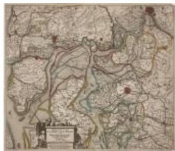
Detail uit Visscher, Nieuwe kaerte van 't Landt van Waes (K 291)