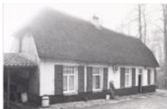
Hoeve te Temse (WAS001000044)