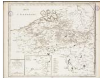
Carte du Hainaut, Flandre, Brabant, Luxembourg et Pais de Limbourg (BWK&P_20110101_107)