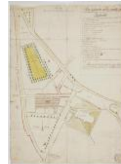
De markt en het centrum van Sint-Niklaas (K 508)