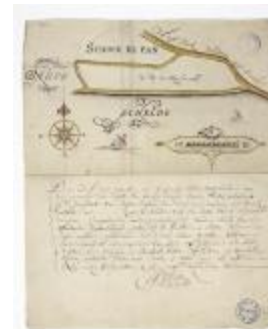
Kaart van een schor nabij Bazel (BWK&P_20120421_135)