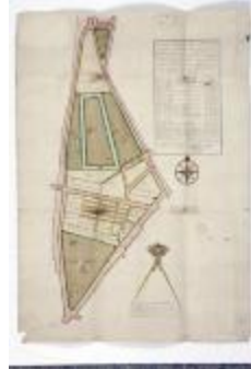
Figuratieve kaart markt Sint-Niklaas, 1765 (SASN20120510_002)