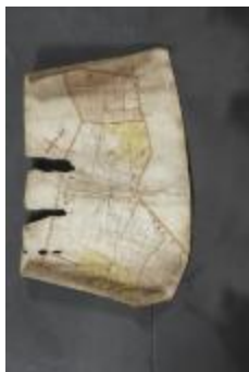
Uittreksel uit ongekend kaartboek van de regio Beveren (_88D9685 kopie)