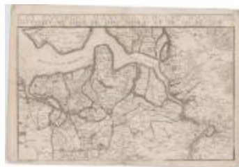
Les environs d'Anvers, d'Hulst, d'Axel, de Santvliet, de Lillo, de Saint-Nicolas et du Sas de Gand (Danet)