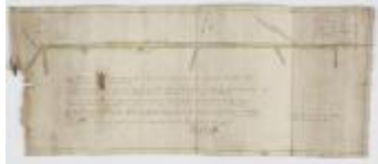
Kaart van grensscheiding Sint-Niklaas en Temse, 1750 (SASN20120510_001)