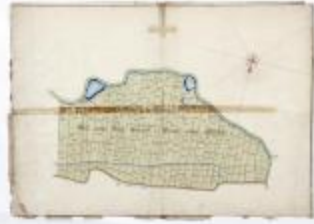
Perceelkaart Schausselbroeck Westeynde (209)