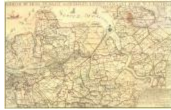
W.T. Hattinga, de Schelde bij Lillo en naast aangelegen landen (Lillo_Hattinga A4)