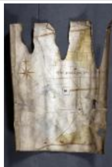
Uittreksel uit ongekend kaartboek van Haasdonk (_88D9696 kopie)