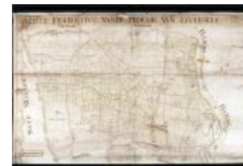
Figuratieve kaart van Elversele, 1716 (_88D5734 kopie)