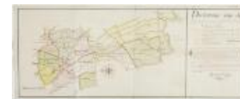
Figuratieve geaquarelleerde kaart van de kasselwegen te Sint-Niklaas (Keure226)