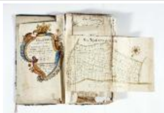
Kaartboek Stekene (KOKW Kaartboek Stekene Vergouwen)