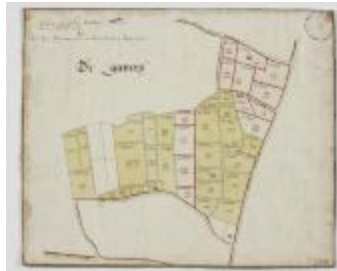
Wijkkaart van Haadonk, omgeving De Gavers (K 478)