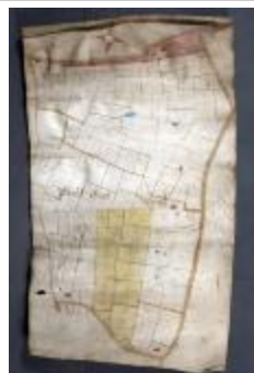
Uittreksel uit ongekend kaartboek van Haasdonk (_88D9694 kopie)