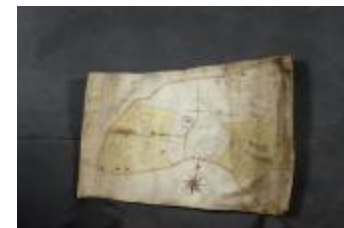
Uittreksel uit ongekend kaartboek van Haasdonk (_88D9691 kopie)