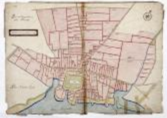
Dorp Temse met dorpsnummers (192)