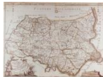
J.B. de Bouge, Carte Topographique du Pays de Waes (K 373)