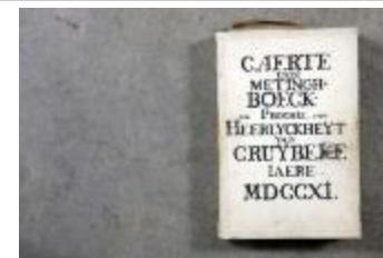
Landboek van Kruibeke (Landboek_Kruibeke)