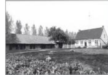
Hoeve uit 1780, Sinaai (WAS001000007)