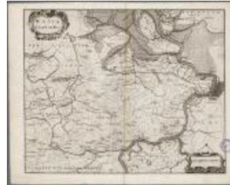
Wasia - 't Land van Waes (BWK&P_20110101_093)