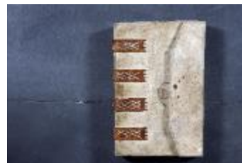
Landboek van Melsele (GAB20122522_001)