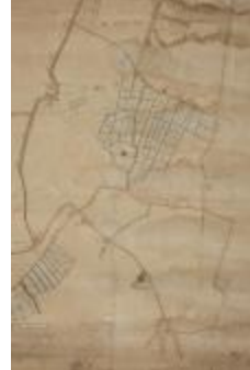
Figuratieve kaart Vrasene, 1767 (SASN20120510_009)