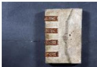
Kaartboek Melsele (Kaartboek Melsele)