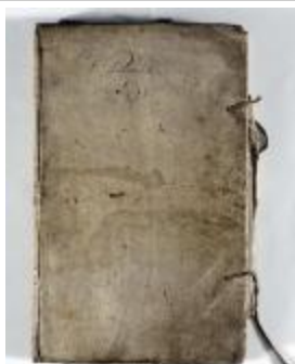
Kaartboek Sint-Pauwels (KOKW Kaartboek Sint-Pauwels Maes)