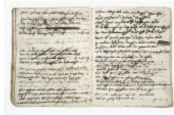
Journal van inkomsten en uitgaven (schenking2005.01)