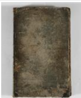
Kaartboek Sint-Gillis-Waas (KOKW Kaartboek Sint-Gillis-Waas Du Caju)