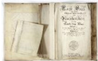
Kaartboek Nieuwkerken, met wijkaarten, 1726 (SASN20120510_011)