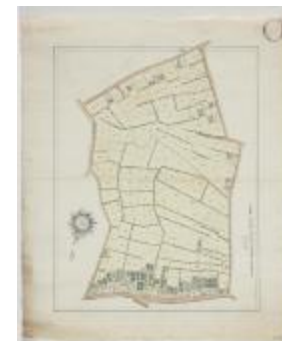
Wijkaart Borntmeulenakker, Stekene (K 452)