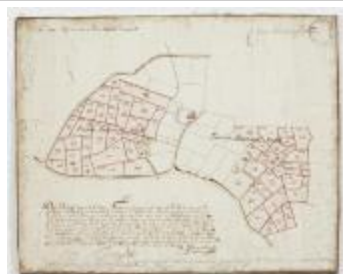
Figuratieve Caerte van de Cabbeljau Thiende (K 473)