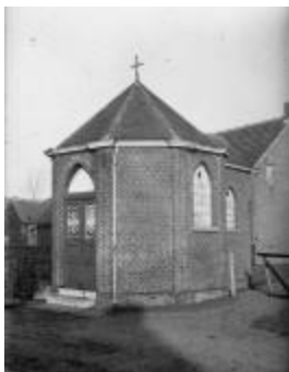
Kapel Sint-Antonius van Padua, Zandstraat (HKDKSP20170510-064)