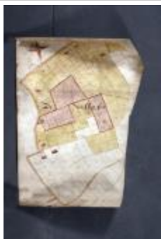
Uittreksel uit ongekend kaartboek van Haasdonk (_88D9692 kopie)