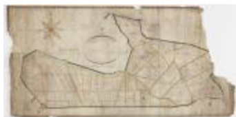
Polderkaart van de dijkage van Kallo (K 547)