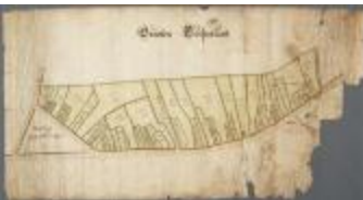
Grooten Clooslant (BWK&P_20110101_105)