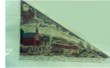
Bedevaartvaantje Sint-Cornelis (PCPP20110912001)