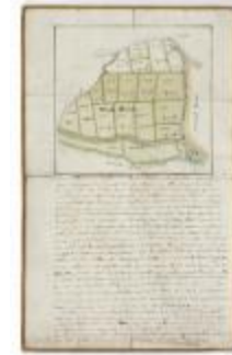
Perceelkaart Meulenbroeck (210bis)