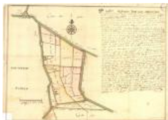
Perceelkaart van de regio Arenbergpolder (K 588)