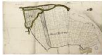
Vierden brouckwijk (Bazel) (BWK&P_20120417_002)