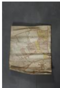
Uittreksel uit ongekend kaartboek van Haasdonk (_88D9686 kopie)