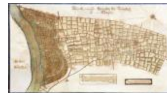
Figuratieve kaart van de heerlijkheid van Cauwerburgh (GAT20120521_001)