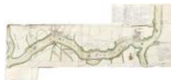
De Schelde met aangrenzende gronden, 1747 (_88D5713 kopie)