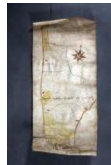
Uittreksel uit ongekend kaartboek van Haasdonk (_88D9698 kopie)