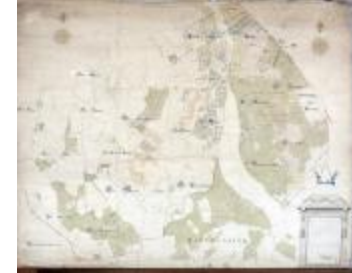
Kaart van heerlijkheden het Beverse, Puiembeke, Paddeschoot en Aarschot te Sint-Niklaas, 1786 (SASN20120510_010)