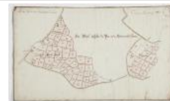
Wijkaart van Haasdonk, omgeving Perstraat en Botermelkstraat (K 475)