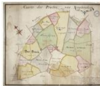
Caerte der prochie van Nieuwerkerken (BWK&P_20120415_114)