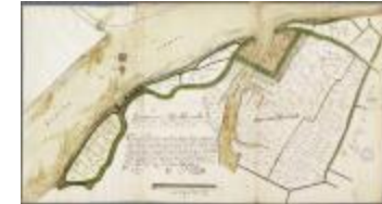
Caerten figurative van alle landen gelegen in Baesel ende Rupelmonde Broeck... (BWK&P_20110101_103)