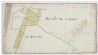
Wijkkaart van Haadonk, omgeving Ropstraat en Bergstraat (K 476)