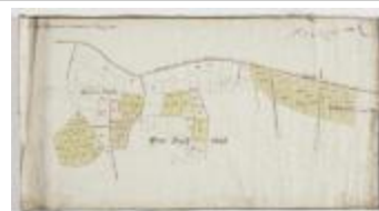
Figuratieve Caerte van de Cabbeljau Thiende (K 474)