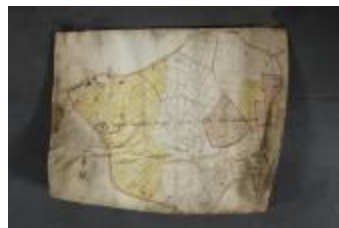
Uittreksel uit een ongekend kaartboek van Haasdonk (_88D9690 kopie)