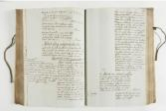
Register van staten van goed van de heerlijkheid Eksaarde. (320)