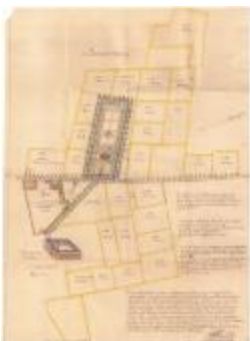
Wijkaart van wijken Kloosterland en Beenaert (Cloosterlant Wijck A4 256/257)